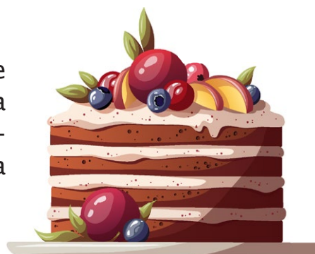
Prezzo medio/Kg per il comparto Pasticceria (Quadrimestre 1/2022; Prezzo volume medio)

Decisamente più elevati i prezzi medi delle offerte web per kg di pasticceria rispetto a quelle flyer, soprattutto nelle famiglie prodotti di cookies\biscotti (+36,5%), ripiena (+42,0%) e altra pasticceria (+44,5%).